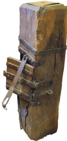
Höjd ca 100 cm.

Exempel på Kyrkstock med två lås, förr även offerstock