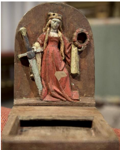
Med Handtag på baksidan. Höjd ca 20cm.

Exempel på Kyrkstock med två lås, förr även offerstock