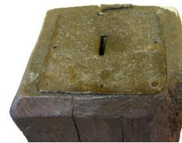
Ca 25 x 25 cm